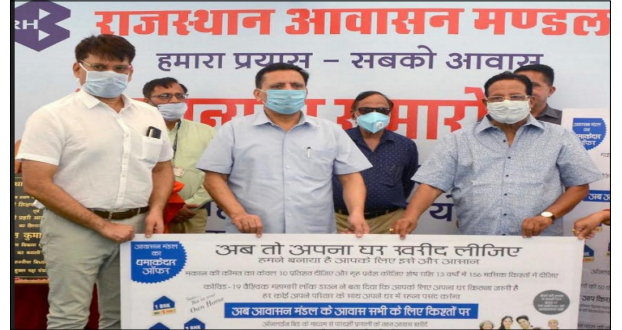
रहा है। बुधवार नीलामी उत्सव के साथ मण्डल की प्रीमियम सम्पत्तियों को खरीदने के लिये खरीदारों में प्रतिस्पर्द्धा दिख रही है। इतने बड़े भूखण्ड का विक्रय रीयल स्टेट के जानकारों के लिये कौतुहल का विषय बना हुआ है। आयुष मार्केट और आतिश मार्केट की 14 दुकानों बिक्री 13 करोड़ रुपये में आयुक्त ने बताया कि मण्डल द्वारा जयपुर के प्रताप नगर में विकसित किये जा रहे आयुष मार्केट की 6 दुकानों 2 करोड़ 94