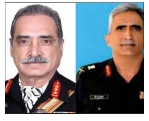
के बीच चल रहे मतभेद को पूर्व सैन्य अधिकारी सेना के अनुशासन के लिए अच्छा नहीं मान रहे हैं। उनका कहना है कि इससे गलत संदेश जाता है। एक रिटायर्ड अधिकारी ने नाम न छापने की शर्त पर बताया कि जब एक समान पद के दो व्यक्ति साथ में काम करते हैं तो कुछ मतभेद होना स्वाभाविक ही है।